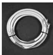
③暖房機と制御盤 接続用ケーブル